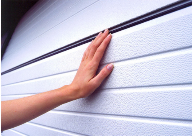
Klemsikre ledd, ute og inne (her på g60-line)