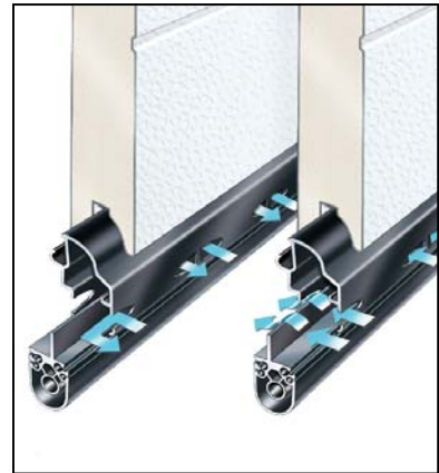
Ventil i bunnpakningen. Kan stenges