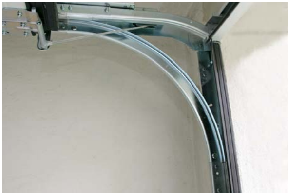
Full innkjøringshøyde med portåpner