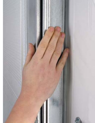
Innkapslede skinner, vaiere og hjul hindrer skader