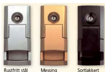
Rustfritt stål Messing Sortlakkert