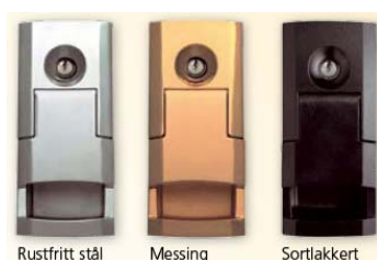
Rustfritt stål Messing Sortlakkert