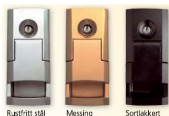
Rustfritt stål Messing Sortlakkert