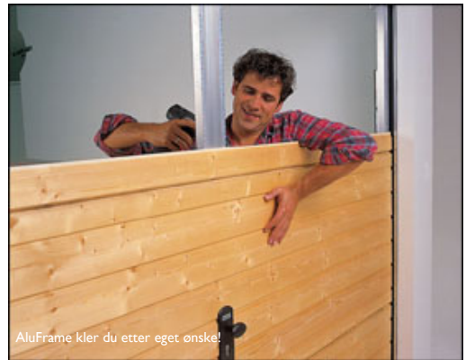
AluFrame kler du etter eget ønske!