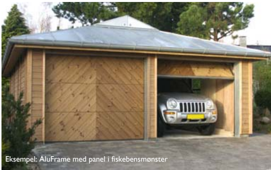
Eksempel: AluFrame med panel i fiskebensmønster