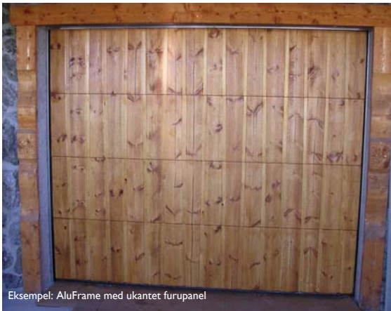
Eksempel: AluFrame med ukantet furupanel