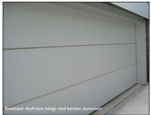
Eksempel: AluFrame belagt med børstet aluminium